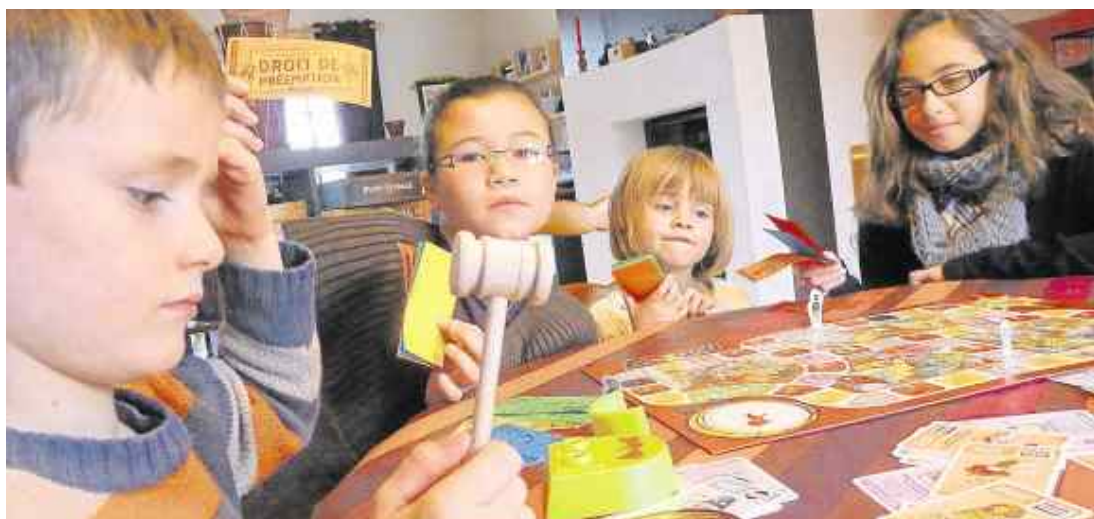
Pour passer un bon moment avec ses enfants, rien ne vaut les jeux de société.

▲ Cocktail games, 3 à 8 joueurs, à partir de 10 ans. 30 €.